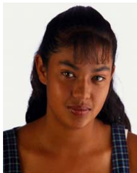
Aprenda sobre sus derechos y responsabilidades como contribuyente

Nuestros talleres cubren una variedad de temas, incluyendo Crédito por Ingreso del Trabajo, Crédito Tributario por Hijo(a), estado de empleado/contratista independiente,